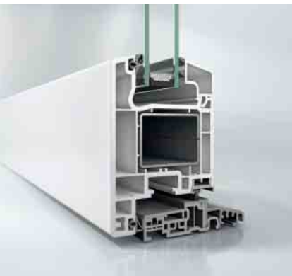
Schüco Corona CT 70 Haustür auswärts öffnend mit barrierefreier Schwelle