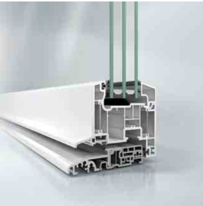
Schüco Alu Inside Fenstertür einwärts öffnend mit barrierefreier Schwelle.

Für Haus-, Nebeneingangs- und Fenstertüren aus Kunststoff