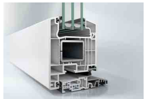
Schüco Thermo 6 Haustür auswärts öffnend mit barrierefreier Schwelle