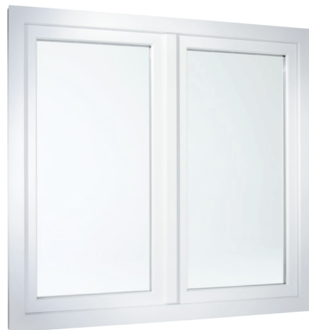
2-flügeliges Fenster in flächenversetzter Variante

Und auch die Technik im Inneren überzeugt: Die Mehrkammerprofile nutzen die isolierende Eigenschaft von Luft und erfüllen so höchste Anforderungen an die Wärmedämmung. Das sorgt nicht nur für angenehmes Raumklima bei jedem Wetter, sondern hilft auch im Winter, die Heizkosten spürbar zu senken.