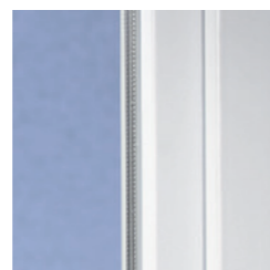
Klassisches Design mit weicher Kontur

Mit modernen Kunststofffenstern aus VEKA Profilen gewinnt jedes Haus. Denn das klassische Design des SOFTLINE Systems mit der leicht abgerundeten Kontur ist zeitlos und harmonisiert hervorragend mit unterschiedlichsten Architekturstilen – ob modern oder traditionell, ob Neubau oder Renovierung.